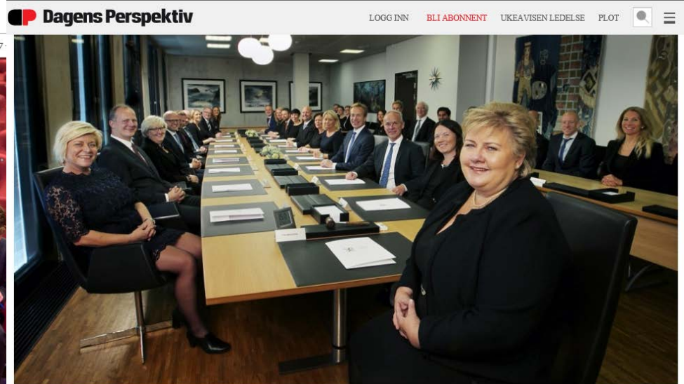
I Norge har 16 ministre til enhver tid ansvar for forskningen innenfor sitt ansvarsområde, men kunnskapsministeren har det overordnede ansvaret.