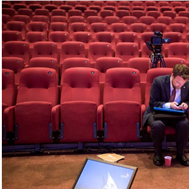
Vi trenger én forskningsminister som er «first among equals», og det har vi. Kunnskapsministeren har et k...

PUBLISERT TORSDAG, 12. OKTOBER 2017 - 22:39 - OPPDATERT TORSDAG, 12. OKTOBER 2017